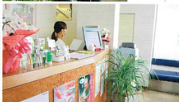
▲待合室の周囲には大きな窓があり、開放感に溢れている (a)。この窓から、正面にある鎌倉駅の駅舎を眺望できる (b)。清潔感のある受付周りには、セルフケアグッズが並ぶ (c)

みました。すると、いろいろなことに興味をもつ私のことをわかっている妻は、臨床や教育、研究といった多方面でかかわれることから、大学に残るのが一番よいのではないかと、暗に伝えてくれました。