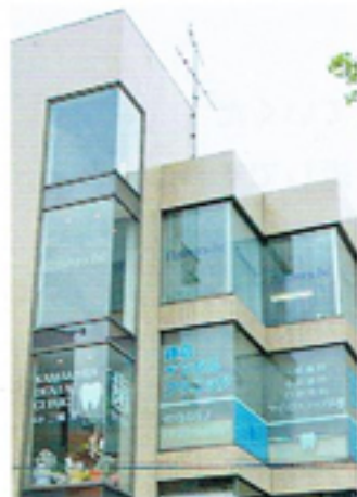
◀ 鎌倉デンタルクリニックの外観。鎌倉駅西口正面のビル3階という好立地にある

「私の妻も歯科医師で、都内の自宅に併設して開業しています。私としては、そこを改装して夫婦で診療することも考えました。前述のようなお誘いを受けていることも含め、自分の今後についてそれとなく妻に相談して